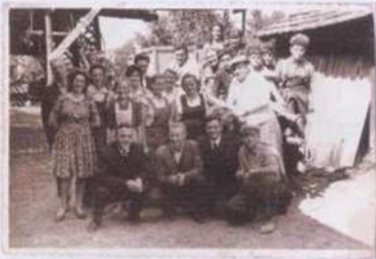
Slika 4: Prihod obiralcev

Obiralci so imeli za pasom obešene posebne košare, v katere so obirali. Ko je bila košara polna, so hmelj stresli vsak v svojo vrečo. Ko pa je prišel kmet, je iz vreče hmelj stresal v "škaf" oziroma mero za hmelj (30l) in izmeril ter si zapisal količino hmelja vsakega obiralca. To je bila osnova za plačilo obiralcev. Iz "škafa" je hmelj stresal v koše, ki jih je imel na vozu.